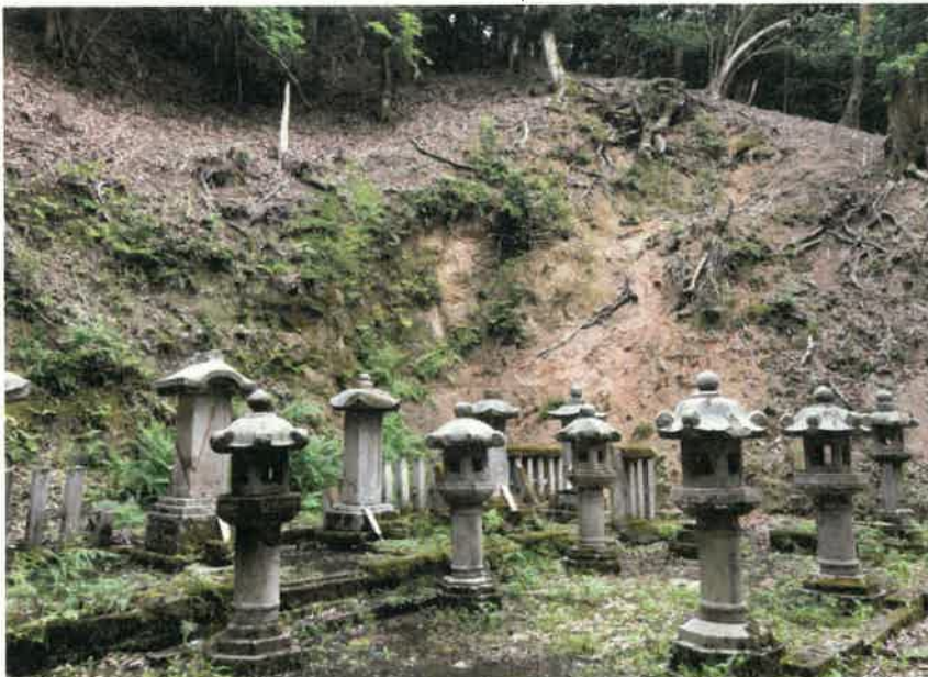
⑦峯山藩主京極家墓所 常立寺(京丹後市)・個人