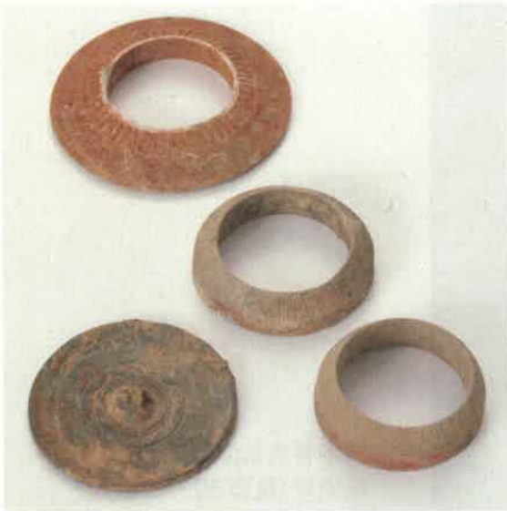
⑤蒲生野古墳出土品 京丹波町