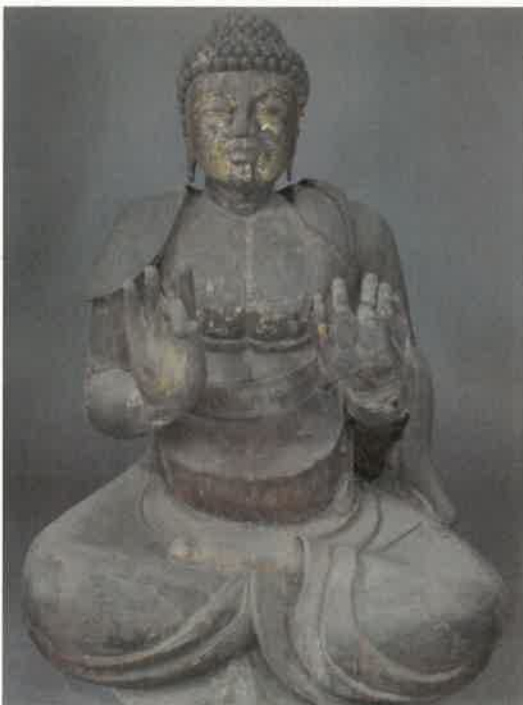
③木造薬師如来坐像 願成寺(亀岡市)