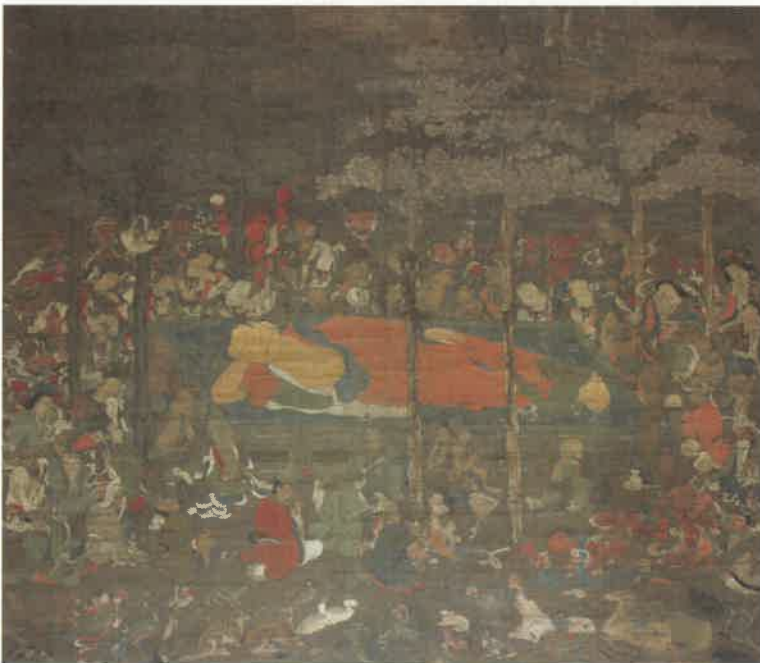
②絹本着色仏涅槃図 極楽寺(亀岡市)