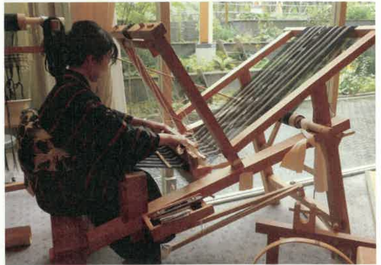
⑥相楽木綿 保護団体：相楽木綿の会(精華町)