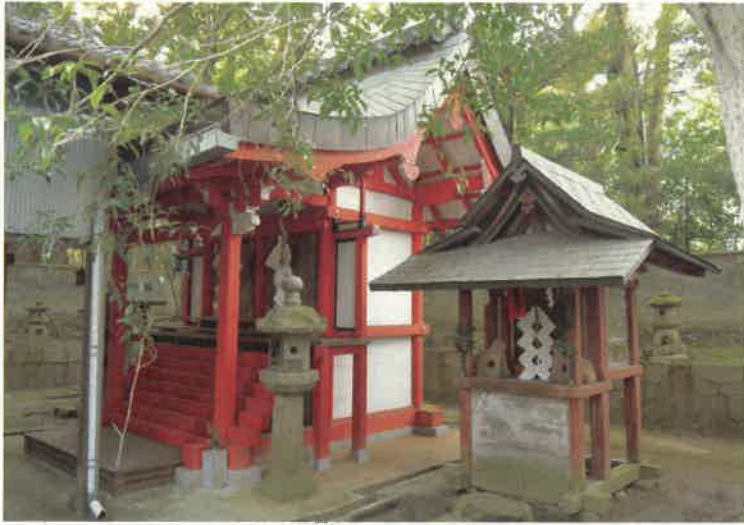
①新殿神社 (精華町) 本殿(左)、末社八王子社(右)